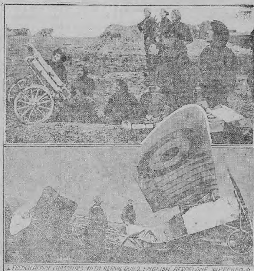
1. FRENCH ALPINE CHASSEURS WITH AERIAL GUN 2. ENGLISH AEROPLANE WRECKED

En el grabado inferior aparecen los restos de un aeroplano inglés. Una bala le atravesó el tanque de gasolina y causó un derrame. El aviator se vió obligado a descender. Creyó que aterrizaba en un lugar seguro pero cayó en un pantano, quebrándole la columna al aeroplano. En el grabado superior se ve un destacamento de cazadores alpinos del ejército francés, empujando un cañón para apuntar a un avión que se eleva en el cielo.