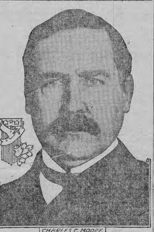
CHARLES C. MOORE

VIENNA.—Official. In Russian Poland and west Galicia no noteworthy incidents have occurred. The battles in the Carpathians are proceeding. In south east Galicia yesterday we occupied Nadworna and forced the enemy back in the direction of Stanislaw.