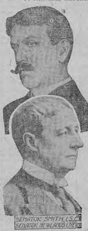
SENATOR SMITH (U.S.C.) SENATOR NEWLANDS (U.S.C.)

WASHINGTON, Feb. 23rd.—It is officially announced that the United States Government will not answer Germany or England relative to the War Zone and the flag case. The consul at Bremen advises of the sinking of the 'Lorraine', and the State Department has ordered an official investigation to be made through the Embassies of London and Berlin.